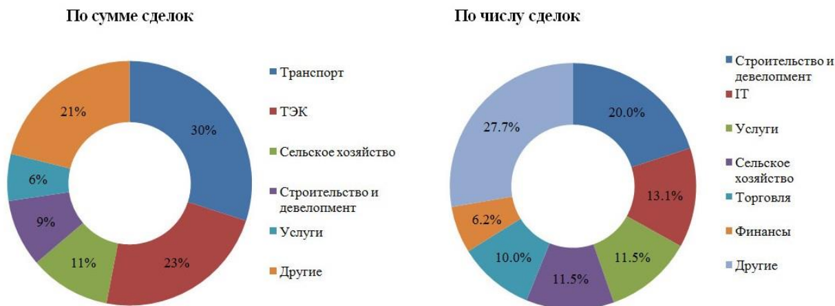
Рисунок 1. Удельный вес отраслей на российском рынке M&A в I квартале 2017 г.

Строительство и девелопмент, которые лидировали в предыдущих годах, в I квартале 2017 года снизили рейтинги. Но, не смотря, на спад количество сделок за этот период выросло на 44,4 % до 26 транзакций.