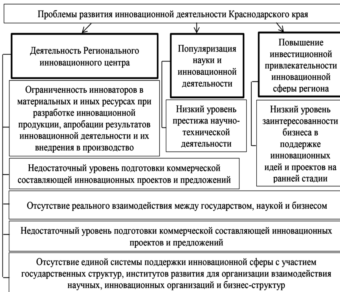
Рис.1. Ключевые проблемы развития инновационной деятельности в Краснодарском крае, требующие оперативного решения

В настоящее время оценку инновационного уровня развития Краснодарского края проводят в три следующих этапа: